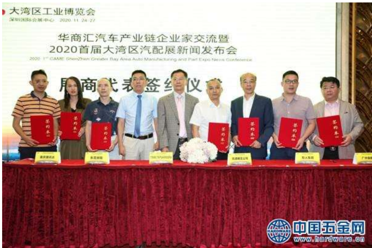
2020 首届大湾区汽配展现场企业签约